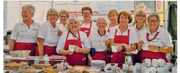
Wanderführer, Wegwarte, unzählige ehrenamtliche Helfer, Vereine und viele fleißige Helfer trugen zum Erfolg des Wandertages bei – hierfür herzlichen Dank!

gagierte Teams am Werk, die nicht auf die Uhr geschaut, sondern sich ums Wohl der Wanderer bemüht haben. Dafür gab es viel Lob und Dank, auch von Ministerpräsident Winfried Kretschmann.